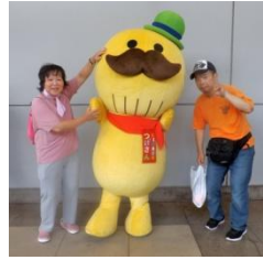
“つげさん”と一緒に記念撮影！！